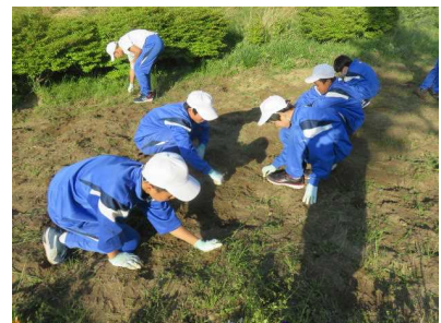
緑化委員 花壇づくり