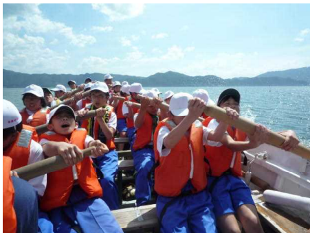
力を合わせてオールをこぐ

10日(火)、11日(水) 1年生は福井県若狭湾に臨海学習に行ってきました。カッター(大型の手こぎボート)訓練や海での水泳など、信州では味わえない体験を通して、クラスの団結も深まりました。